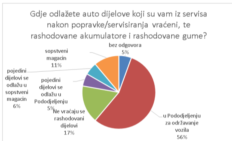
Grafikon 2: Upravljanje zamijenjenim dijelovima

Služba za održavanje vozila, u svojim magacinskim prostorima, skladišti rezervne gume koje su u upotrebi.